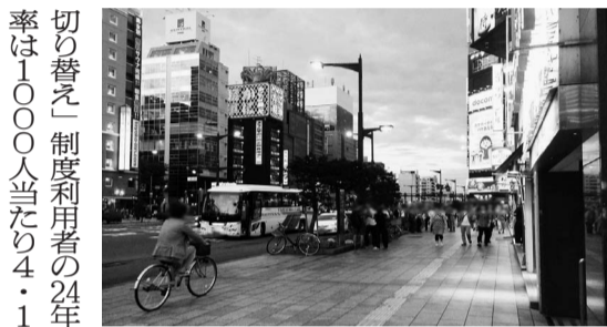
自転車での安全な移動を推し進める(イメージ)

警察庁は、2025年に自転車と歩行者の事故が全国で33269件(前年比226件増)あり、統計の残る06年以降で最多だったと公表した。4月から自転車の違反にも交通反則通告制度(青切符)が導入される。同庁担当者は「引き続き『ながらスマホ』や飲酒運転の危険性、ルールを周知して事故を減らしたい」と話している。