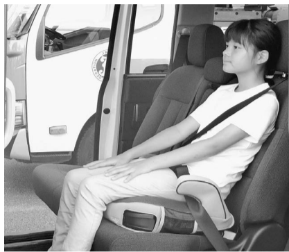
プースターシートを使用すると、肩と腰骨の低い位置に正しくベルトがかかっている

れたとみられる。この事故の前から推奨身長の見直しを検討していたというJAFは「身長150センチ未満はあくまでも目安であり、重要なのは、子どもの首や腹部にシートベルトがかからないことだ」と強調する。道路交通法では、6歳未満の幼児を乗せる場合、チャイルドシートの使用が義務づけられている。ただし、子供によって身長や体格は千差万別