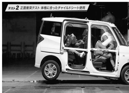
テスト2 正面衝突テスト 体格に合ったチャイルドシート使用

この使用推奨身長目安を150センチ未満に変更した背景には大きく2つの理由がある。一つは、JAFによる調査で、身長140センチであっても、シートベルトが首にかかる