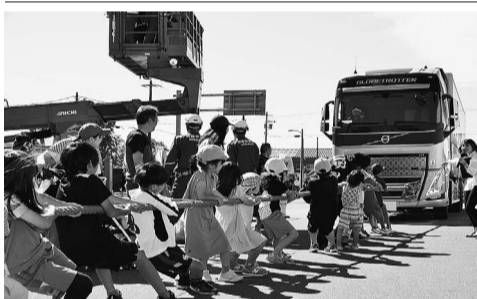
子供たちが大型トラックと綱引きで対戦

ー、女性限定ジャッキアップ・タイヤ交換トライアル等、各所で人だかりができた。また、ステージイベントでは〇×クイズ・ビンゴゲーム大会なども行われ、多くの来場者が参加し、熱を入れてゲームを楽しんだ。その他にも露店コーナー、書空市場による飲食物・農産物の販売、てんけんくんグッズの販売など、お得な催しも用意された。