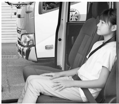
約150センチの身長であっても、シートベルトが首にかかる恐れがあることが分かる

日本自動車連盟(JAF)は、チャイルドシート(ジュニアシート含む)の使用を推奨する身長目安を、これまでの「140センチ未満」から「150センチ未満」に見直した。福岡市で8月に起きた衝突事故で、軽乗用車に乗っていた7歳と5歳の姉妹がシートベルトを着用していたにもかかわらず死亡した。衝突時にシートベルトで腹部が強く圧迫さ