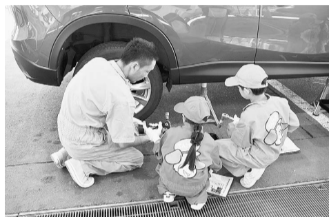
キッズエンジニア

会場では様々なイベントが行われ、てんけんくんの何でも相談コーナー(自動車整備・検査・登録・希望ナンバープレート等の相談)、お子様100円コーナー(ヨーヨー釣り・輪投げ・ストラックアウト)、JAF子ども免許証コーナー、白い車をキャンパスとした落書きコーナー、1926年製大型フォードと初代クラウンの展示、スタンラリー